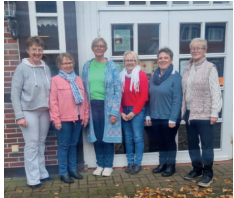
Das Büchertisch- und Kaffeeteam

Wir sind jeweils von 14.00 – 18.00 Uhr für Sie da!